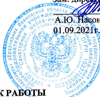
ГРАФИК РАБОТЫ дежурных администраторов на 2021 – 2022 учебный год.